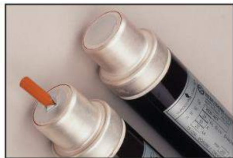
FUSE WITH STRIKER PIN

فیوزهای دارای نشانگر اپتیکی یعنی تیپهای H220 و H221 ، مکانیسم نشان دهنده عملکرد فیوز دارند. هنگامی که فیوز بر اثر خطایی عمل می کند، یک در پوش قرمز رنگ داخل محفظه شیشه ای انتهای فیوز قرار می گیرد.