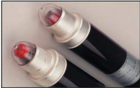
FUSE WITH OPTICAL INDICATOR

اندازه تمامی فیوزهای تولیدی مطابق با استاندارد IEC60828 و DIN43625 می باشد و برای مصارف محیطهای داخلی (Indoor) و خارجی (Outdoor) مناسب می باشند.